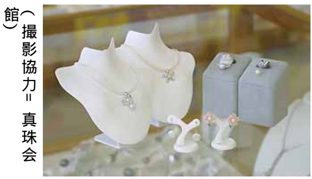
（撮影協力）真珠会館

生産量全国トップを誇る宇和島真珠は、パールアクセサリーの需要を伸ばすべく、真珠の加工技術やデザインを、産地ならではの個性を活かして、ファッションに合わせたパールを開発している。また、真珠の産地として知られる宇和島は、真珠の産地としてだけでなく、真珠の産地としての魅力を、観光や教育などを通じて発信している。