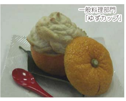
一般料理部門 「ゆずカツカレー」

1月31日、真珠のまちなみPRするイベント「第2回パール食コンテスト」が開催されました。真珠に関する素材を使うか、真珠をイメージしたデザインのオリジナル料理「パール食」、宇和島圏域の食材を使うか、郷土を連想させるオリジナル料理「一般食」のそれぞれ料理・スイーツ部門の最優秀賞が選ばれました。（受賞作品は市ホームページに掲載）