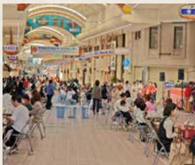
▲多くの人でにぎわう会場の様子

今回は20組の出店者が挑 戦し、私は審査員の1人と して皆さんが腕によりをか けた作品を試食。どれも地 元の食材が巧みに扱われ、 正に甲乙つけがたいとはこ