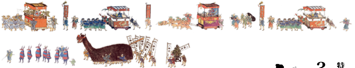
「吉田祭礼絵巻（利根翠塙模写本）個人蔵」を加工・転載 題字：中澤京苑