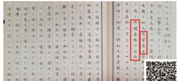
『龍山公記』より「泉貨居士」「御國産御一之品」部分（公財）宇和島伊達文化保存会蔵 ID: 0081913