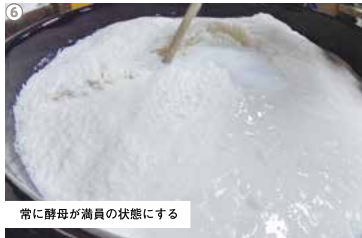
常に酵母が満員の状態にする