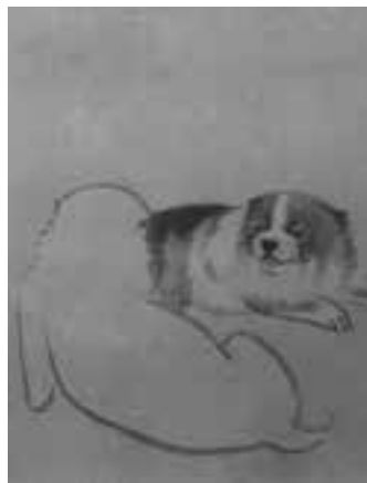
【子犬図】(公財)宇和島伊達文化保存会蔵