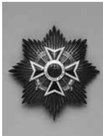
【布哇第二等勳章 宗城公】(公財)宇和島伊達文化保存会蔵