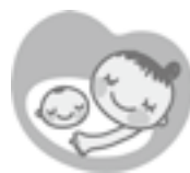
マタニティマーク