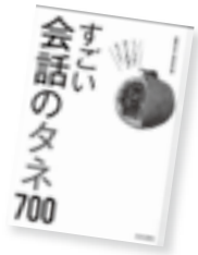
すごい会話のタネ700