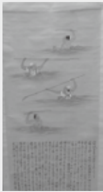
「小堀流踏水術関係資料」（浅野家旧蔵）館蔵品

【開館時間】午前9時～午後5時（月曜休館。祝日の場合は翌日） 【入館料】大人500円、高校・大学生・65歳以上400円、中学生以下無料