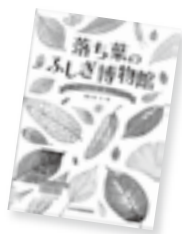
おぼろ葉のふしぎ博物館

さまざまなジャンルから、森羅万象の雑談の「タネ」を集めに集めた珠玉の宝箱。どんな相手も必ず「陥落」する、即効トークの秘密、教えます。