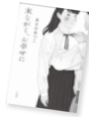
未ながく、お幸せに

冬が近づくと、落ち葉は集まる虫たちで賑やかになります。ふしぎな落ち葉の世界をのぞいてみてください。落ち葉を見る目がきつと変わっているでしょう。