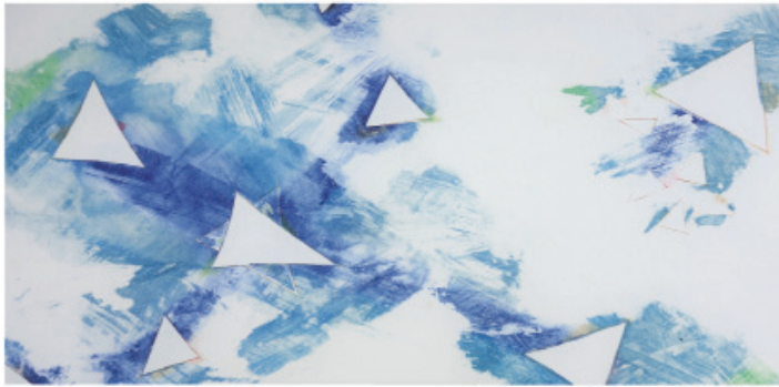
中野山美術展「応高クラブ」表紙(左) 備後) エッタンダ・ビュラン