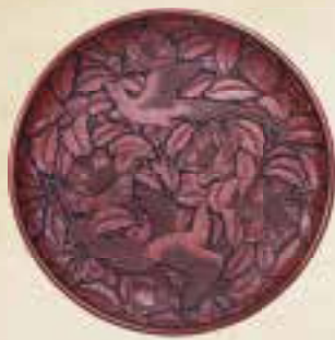
「椿尾長鳥模様堆朱盆」張成作(大徳寺興臨院蔵 京都国立博物館寄託品 国指定重要文化財)

今回の春期特別展では、伊達家に伝来する秀吉を中心とした桃山期の資料と政宗以来の唐物の茶道具(小茄子茶入)などを中心に、千利休ゆかりの青井戸茶碗、茶会記やわびが感じられる禅語の掛軸、舶来の油滴、玳瑁、灰被、建盞のさまざまな天目茶碗を京都の利休にゆかりのある大徳寺などから借用展示することによって、例年とは異なる視点から宇和島伊達家の多数の名品を紹介いたします。ぜひお越しください。