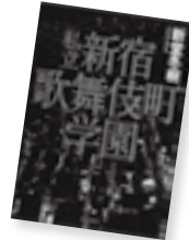
私立新宿歌舞伎町学園

たのしい旅が始まる「羽田空港」のすべて。最新型の飛行機が並ぶ。空港にしかない車やはたらく人もいっぱい。どのシーンも目をはなせない「羽田空港」のすごさに感動！（主要部分は英訳つき）