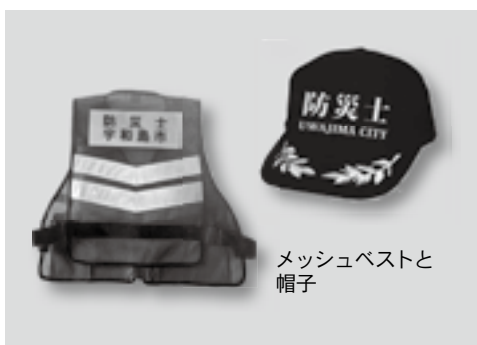
メッシュベストと帽子

災害などの際、地域防災のリーダーとなる防災士の育成を目的として、防災士の統一ユニホーム(メッシュベストと帽子)を購入しました。購入したユニホームは、市内在住の防災士(希望者)に対して、無償貸与されます。