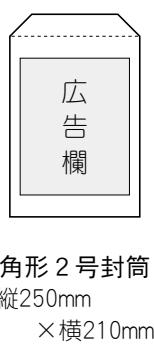
角形2号封筒 縦250mm × 横210mm