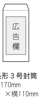
長形3号封筒 縦170mm × 横110mm